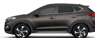
MOON ROCK (XN3 - PERŁOWY)