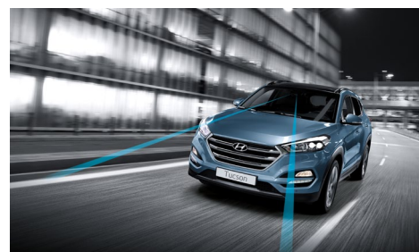
Asystent utrzymywania pasa ruchu