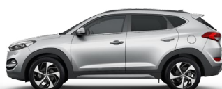
PLATINIUM SILVER (U3S - METALIK)