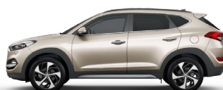
WHITE SAND (Y3Y - METALIK)