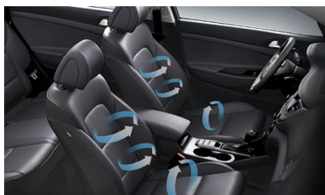
Elektrycznie sterowane, podgrzewane i wentylowane fotele przednie