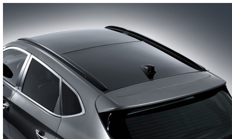
Panoramiczne okno dachowe

Pierwsze egzemplarze nowego Hyundai Tucson w Polsce tworzą edycję limitowaną Tour de Pologne. Oprócz specjalnego znakowania nawiązującego do największej imprezy kolarskiej w Polsce, edycja limitowana oferuje niezwykle bogate wyposażenie. Tylko teraz nowy Tucson dostępny jest z pełnym wyposażeniem w standardzie.