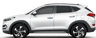
POLAR WHITE (PYW)