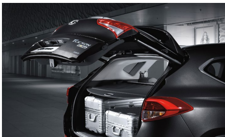
Inteligentna kłapa bagażnika