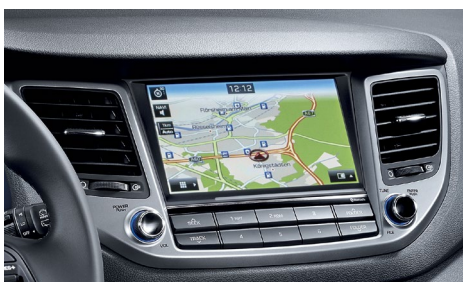
Nawigacja 8'' z TomTom Live i pakietem 6 aktualizacji MapCare