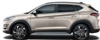
WHITE SAND * (Y3Y - METALICZNY)