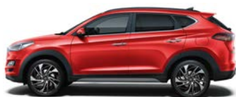
ENGINE RED (JHR - BEZ DOPLĄTY)