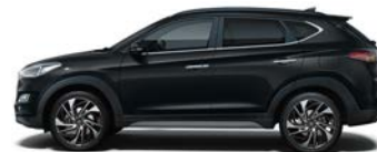
PHANTOM BLACK (PAE - PERŁOWY)