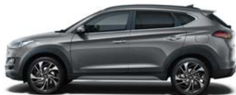
MICRON GREY * (Z3G - METALICZNY)