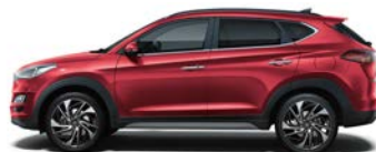
SUNSET RED (WR6 - PERŁOWY)