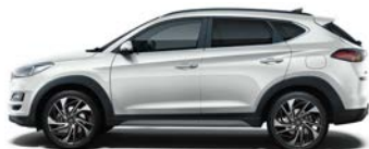
PLATINUM SILVER (U3S - METALICZNY)