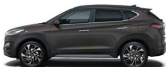
DARK KNIGHT (YG7 - PERŁOWY)

* Sprawdź dostępność u dealera ** Tylko dla wersji N Line