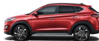
FIERY RED * (PR2 - METALICZNY)