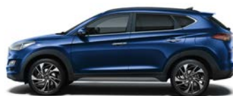
STELLAR BLUE (RWB - METALICZNY)