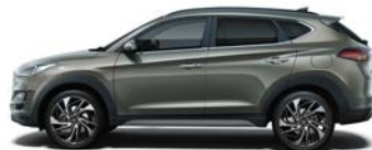
OLIVINE GREY (X5R - METALICZNY)