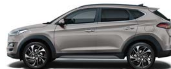
SILKY BRONZE (B6S - METALICZNY)