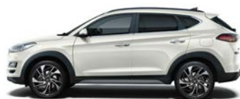
POLAR WHITE (PYW - BEZ DOPLĄTY)