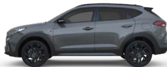
SHADOW GREY * (TKG - SPECJALNY)